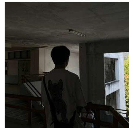
นาย เอ (เป็นนามสมมติ) นักศึกษามหาวิทยาลัยเชียงใหม่